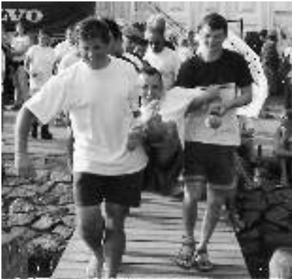
...Take me to the river...