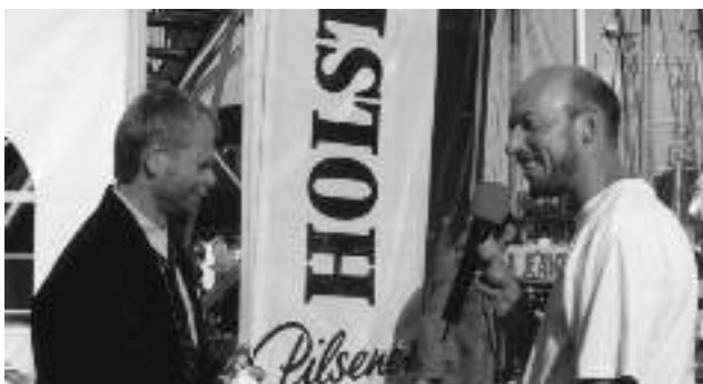
Die Zwei - Wettfahrtleiter und Chef.