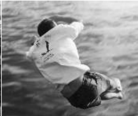
...duck me in the water...